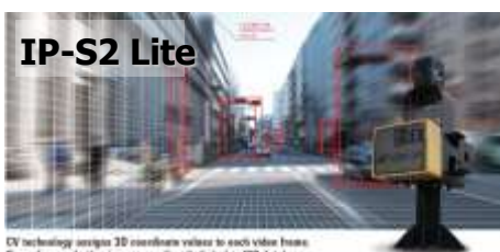
CV technology assigns 3D coordinate values to each video frame. Geo-referenced video images are directly linked to GIS databases.