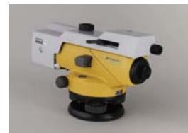
光学マイクロメーター OM5 (AT-B2)

接眼部に取付けることにより、90度方向からのぞくことができます。低位置での観測や、狭い場所での観測に便利です。