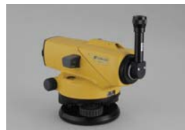
ダイアゴナルアイピース DE16 (AT-B2)

接眼部に取付けることにより、90度方向からのぞくことができます。低位置での観測や、狭い場所での観測に便利です。