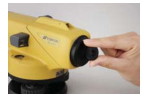
40x 接眼レンズ EL5 (AT-B2)

望遠鏡に光学マイクロメーターを取り付けることにより0.1mmまで高さを読取ることが可能となります。精密水準測量、工作機械の据付等、高精度が要求される作業に活用いただけます。