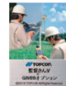
監督さん.V+ GNSS オプション*1 (FC-500)