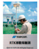
RTK 移動局観測 (FC-500) (近日発売)